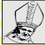
(Johannes Paul II.)