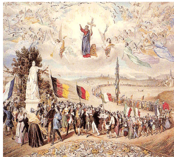
Allegorie auf den Völkeraufbruch 1849