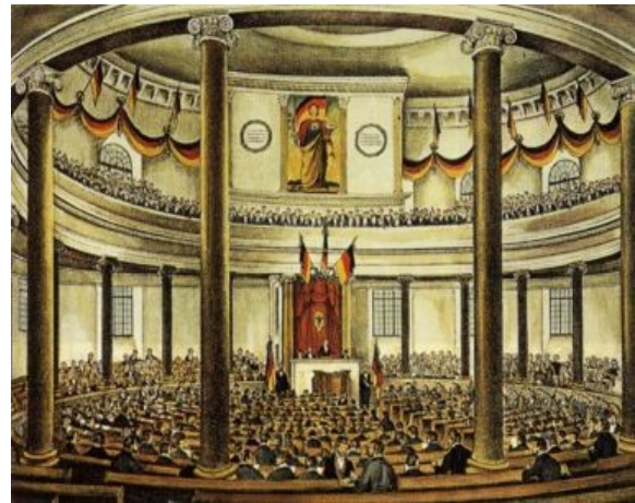
Blick in den Plenumsaal der Paulskirchen-Versammlung