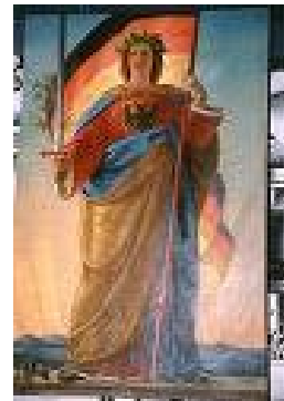
Germaniabild über dem Rednerpult